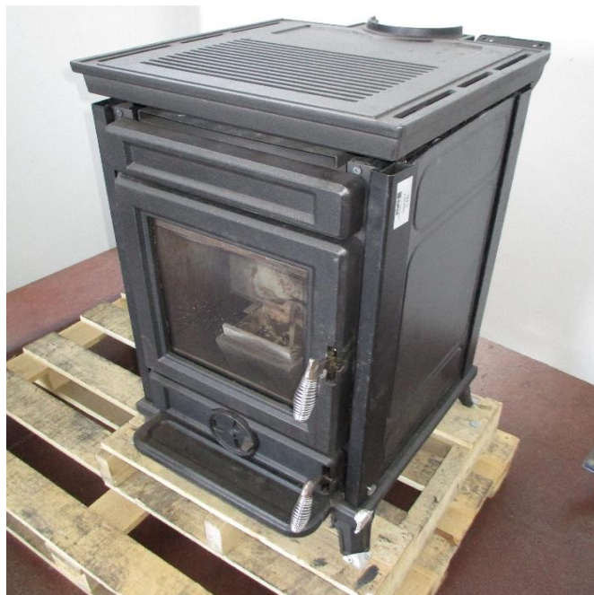
Campione selezionato a cura del fabbricante / Sample selected by the manufacturer

Apparecchio alimentato a pellet di legno composto da camera di combustione, serbatoio pellet, sistema di caricamento automatico. I prodotti da combustione vengono espulsi mediante l'impiego di un estrattore fumi. Il riscaldamento del locale in cui viene installato l'apparecchio avviene mediante l'utilizzo di ventilatori.