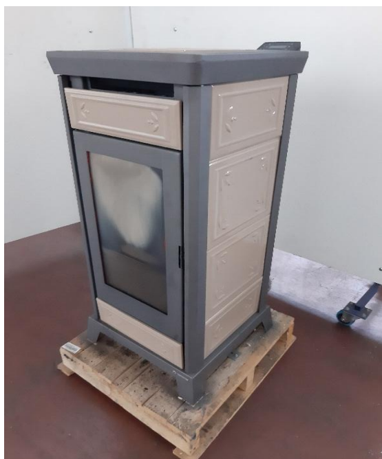
Campione selezionato a cura del fabbricante / Sample selected by the manufacturer

Apparecchio alimentato a pellet di legno composto da camera di combustione, serbatoio pellet, sistema di caricamento automatico. I prodotti da combustione vengono espulsi mediante l'impiego di un estrattore fumi. Il riscaldamento del locale in cui viene installato l'apparecchio avviene mediante l'utilizzo di ventilatori.