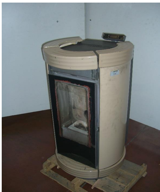
Campione selezionato a cura del fabbricante / Sample selected by the manufacturer

Apparecchio alimentato a pellet di legno composto da camera di combustione, serbatoio pellet, sistema di caricamento automatico. I prodotti da combustione vengono espulsi mediante l'impiego di un estrattore fumi. Il riscaldamento del locale in cui viene installato l'apparecchio avviene mediante l'utilizzo di ventilatori.