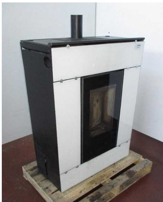
Campione selezionato a cura del fabbricante / Sample selected by the manufacturer

Apparecchio alimentato a pellet di legno composto da camera di combustione, serbatoio pellet, sistema di caricamento automatico. I prodotti da combustione vengono espulsi mediante l'impiego di un estrattore fumi. Il riscaldamento del locale in cui viene installato l'apparecchio avviene mediante l'utilizzo di ventilatori.