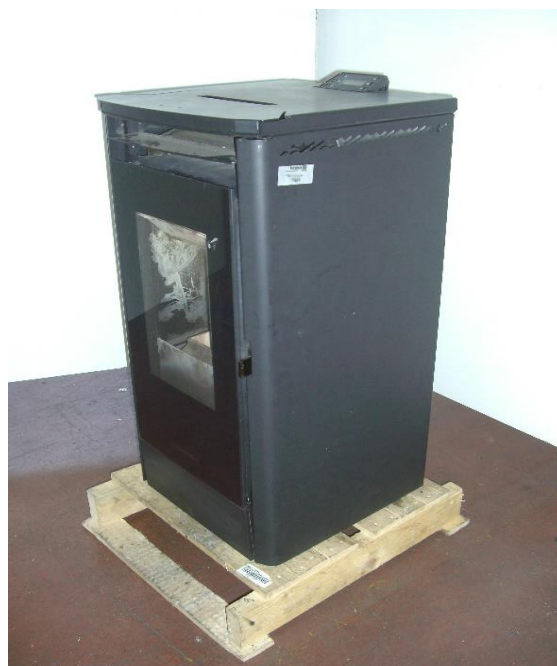
Campione selezionato a cura del fabbricante / Sample selected by the manufacturer

Apparecchio alimentato a pellet di legno composto da camera di combustione, serbatoio pellet, sistema di caricamento automatico. I prodotti da combustione vengono espulsi mediante l'impiego di un estrattore fumi. Il riscaldamento del locale in cui viene installato l'apparecchio avviene mediante l'utilizzo di ventilatori.