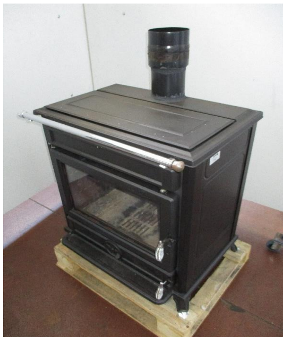
Campione selezionato a cura del cliente / Sample selected by the customer

Apparecchio alimentato a ciocchi di legno composto da camera di combustione, cassetto cenere, forno di cottura e cassetto di deposito materiale non combustibile. I prodotti da combustione vengono espulsi mediante tiraggio naturale. Il riscaldamento del locale in cui viene installato l'apparecchio avviene mediante irraggiamento e convezione naturale.