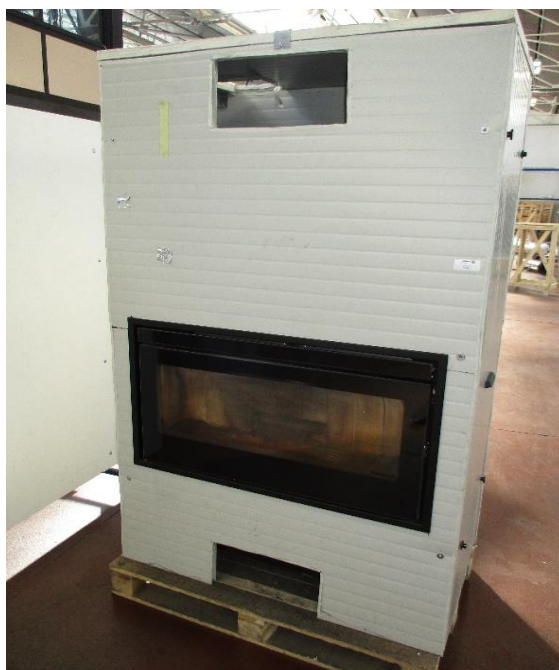
Campione selezionato a cura del fabbricante / Sample selected by the manufacturer

Apparecchio alimentato a pellet di legno composto da camera di combustione, serbatoio pellet, sistema di caricamento automatico. I prodotti da combustione vengono espulsi mediante l'impiego di un estrattore fumi. Il riscaldamento del locale in cui viene installato l'apparecchio avviene mediante l'utilizzo di ventilatori.