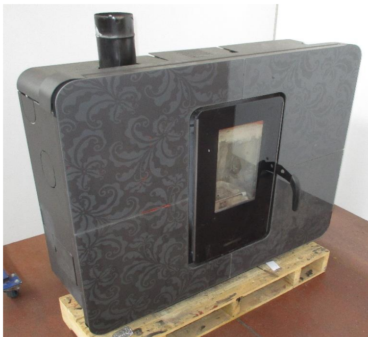
Campione selezionato a cura del fabbricante / Sample selected by the manufacturer

Apparecchio alimentato a pellet di legno composto da camera di combustione, serbatoio pellet, sistema di caricamento automatico. I prodotti da combustione vengono espulsi mediante l'impiego di un estrattore fumi. Il riscaldamento del locale in cui viene installato l'apparecchio avviene mediante l'utilizzo di ventilatori.